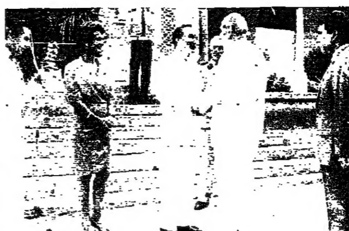
السفير الايستقيل الرئيس شارل حلو